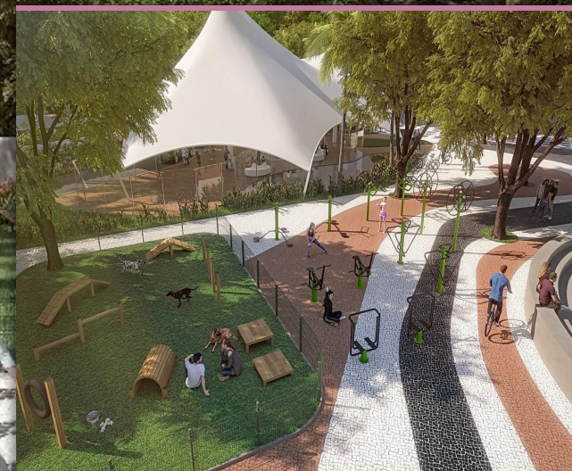
VISÃO DO PROJETO