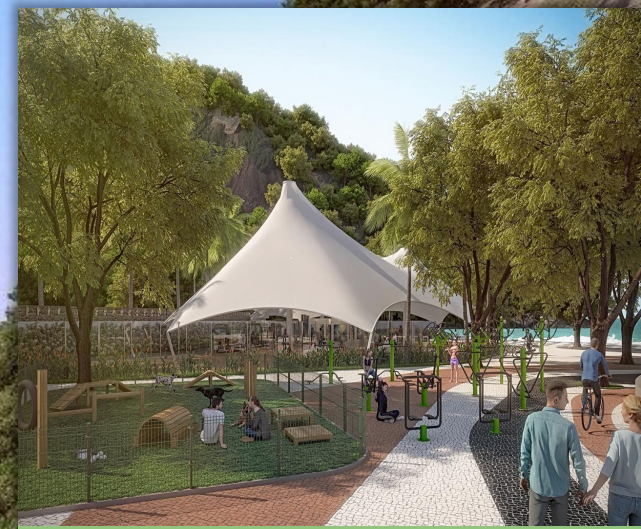
VISÃO DO PROJETO